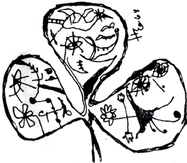
Hernán Castellano Girón Ilustración para "Tres Pesadillas" (Kraal, 1965) pluma y tinta china