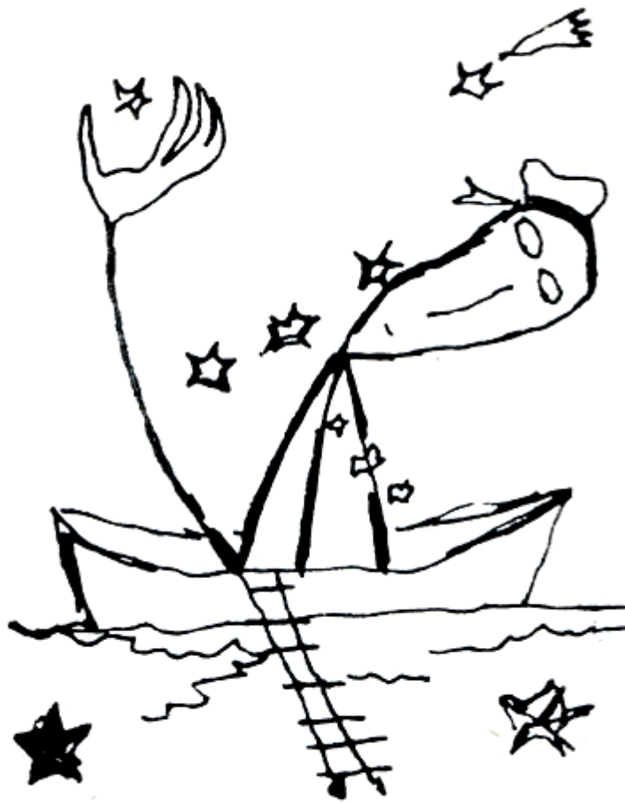
Hernán Castellano Girón Ilustración para "La ecuación" (Kraal, 1965) pluma y tinta china